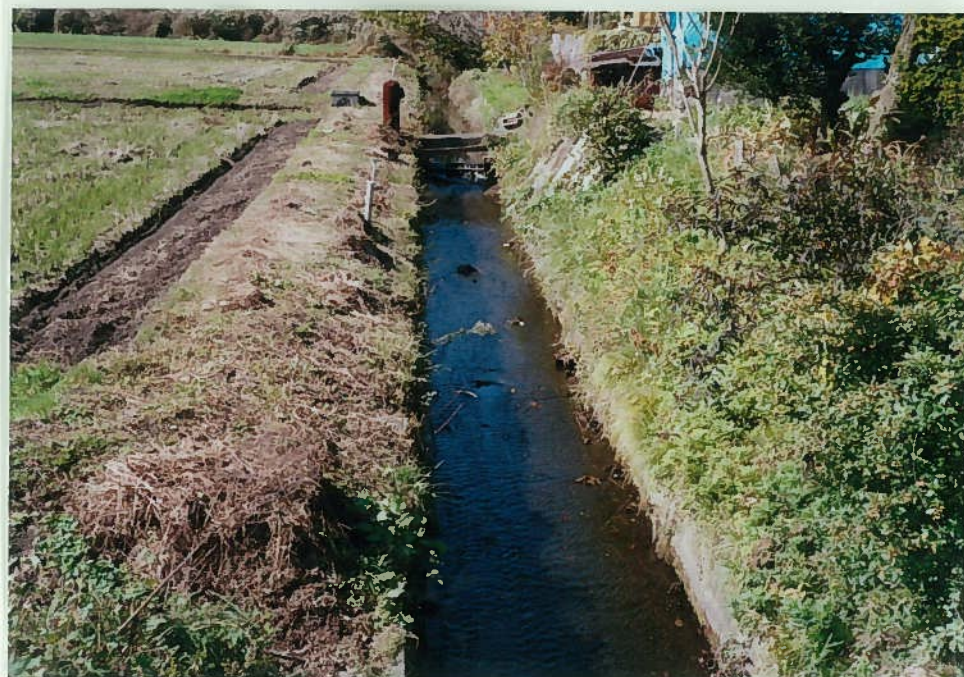
64)栗住川 9. 三面張工 川は全てコンクリートで固められている。