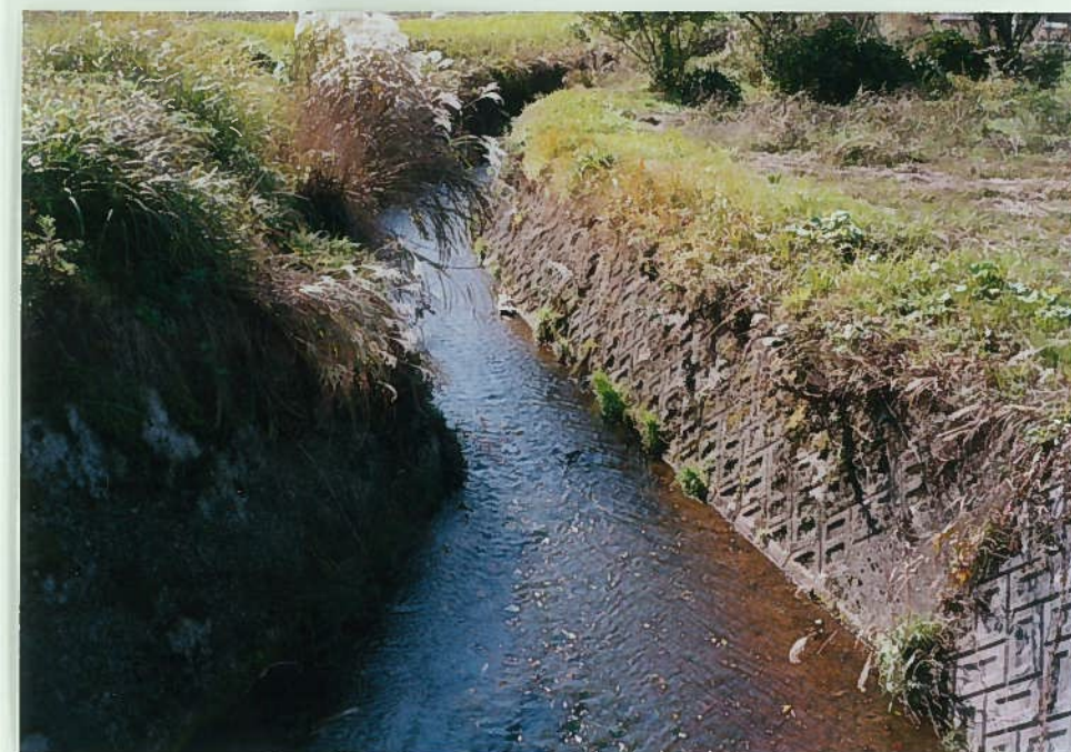
64)栗住川 8. 三面張工