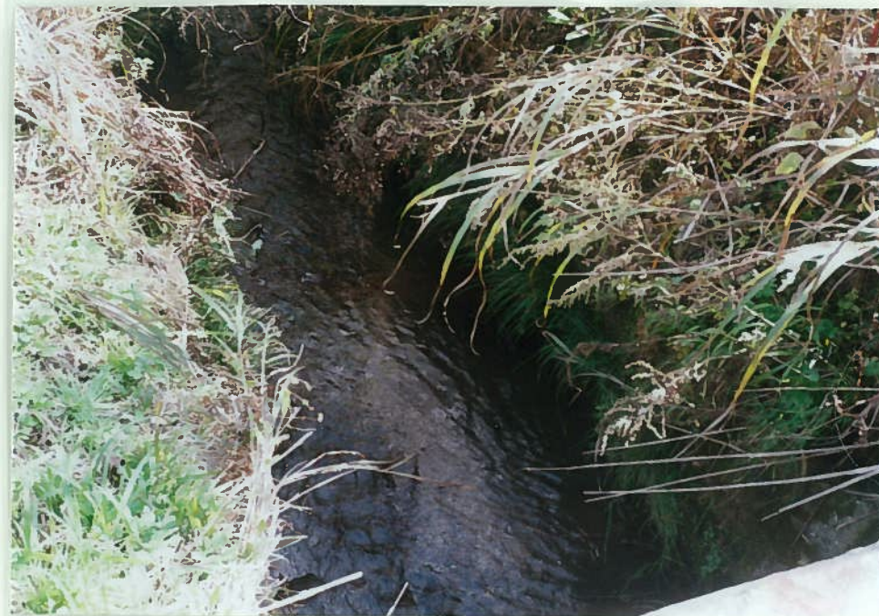
64)栗住川 7. 三面張工 コンクリートで固められ、魚はいない。