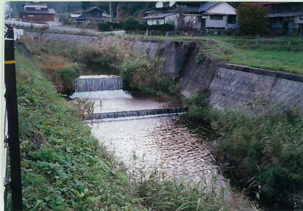
65) 田部川 13. 頭首工 h = 1.5 \text{ m} 魚の遡上は困難であ る。