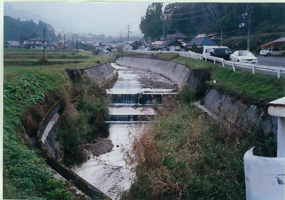
65) 田部川 14. 頭首工 h = 1.5 \text{ m} 同上 上はヨシを掃除して いる。