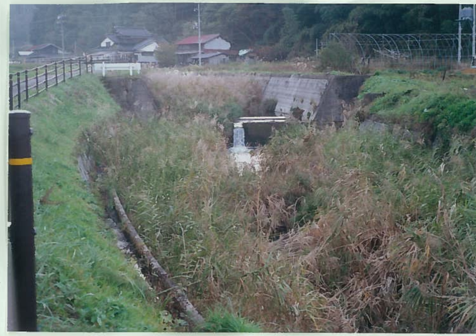
65) 田部川 12. 頭首工 h = 1.5 \text{ m} ヨシが茂り、川の流 れは細い。