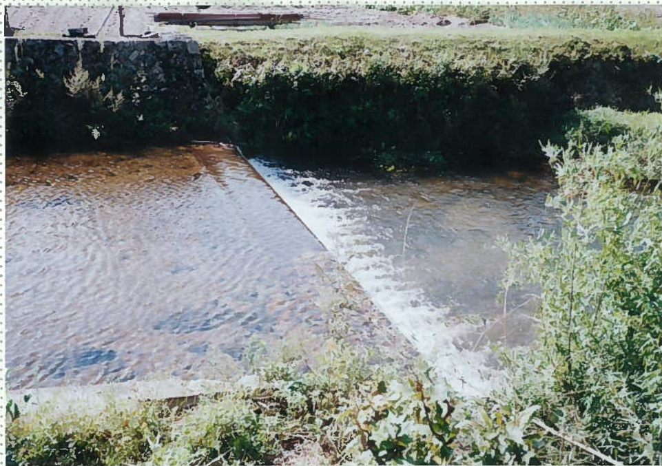
41)下和川 4. 頭首工。h = 1.5m。