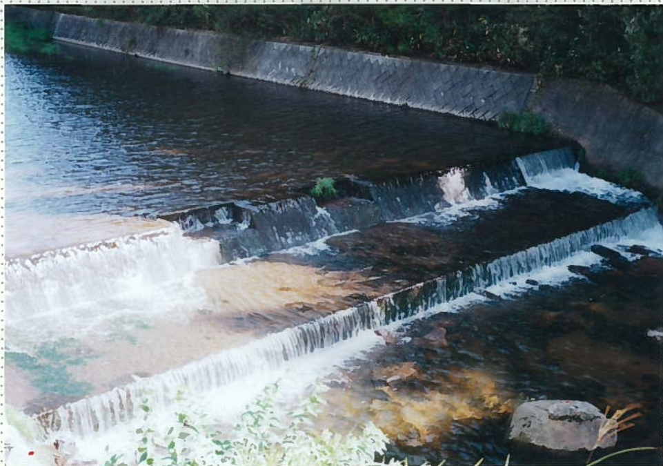
42)下和川 5. h = 0.5 × 2段。