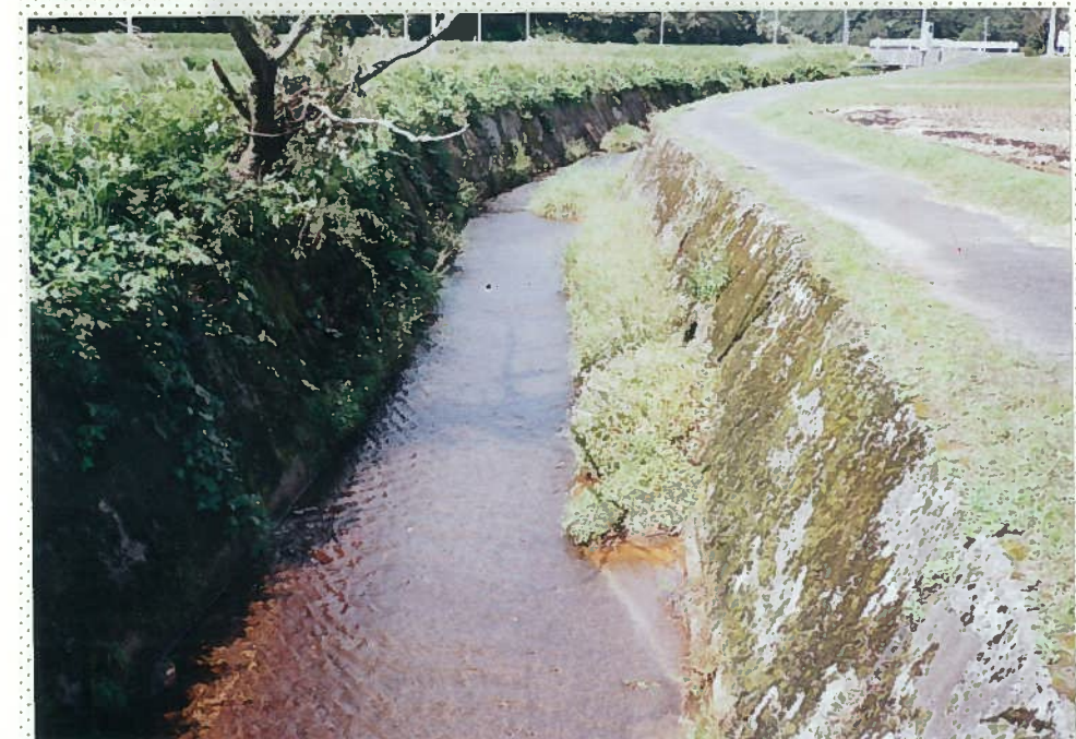
42)下和川 9. コンクリート三面張河川。魚は全くいない。