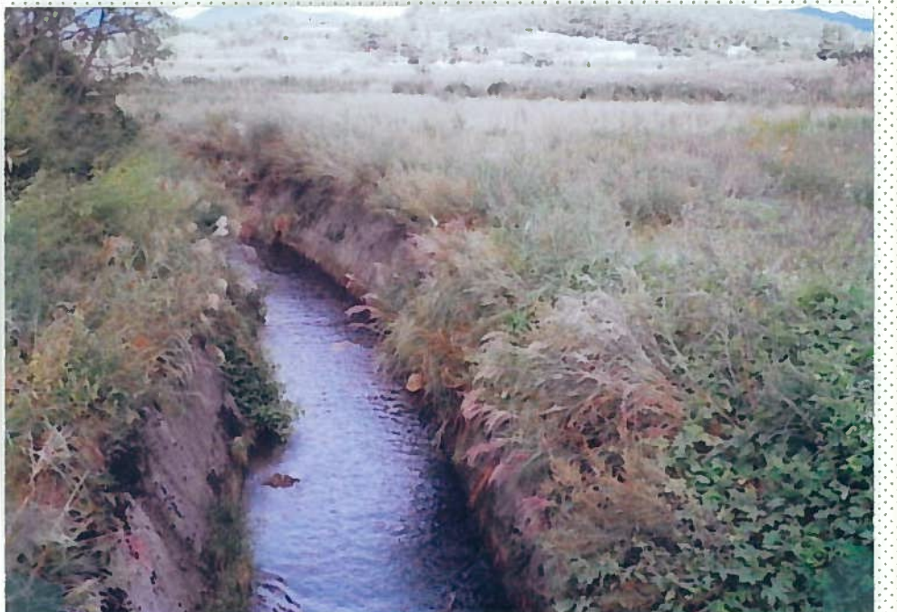
42)下和川 20. 同上。圃場整備で全て三面張河川として いる。