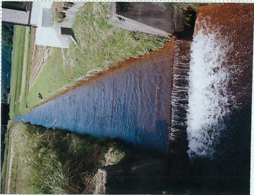
42)下和川 10. 三面張河川。圃場整備 備で完全に人工川に 改修されている。 段差工もあり、魚は 全くいない。