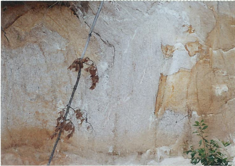
42)下和川 16. 風化花崗岩。マサ土。 本地域に広く分布する。