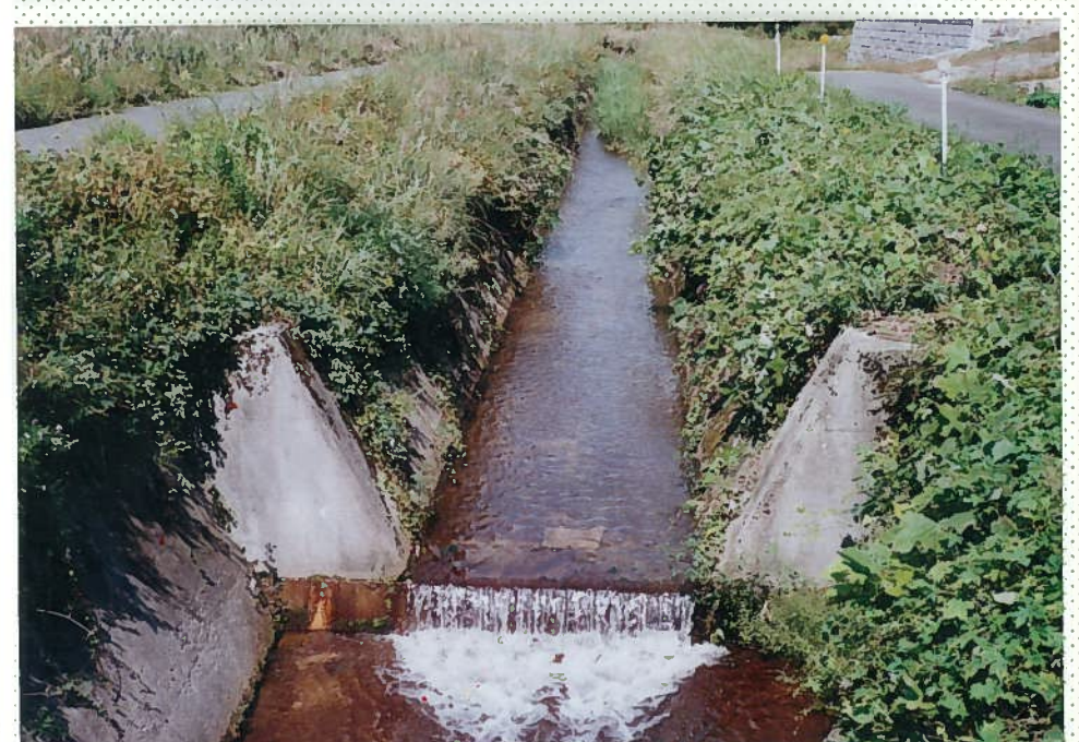
42)下和川 21. 同上。