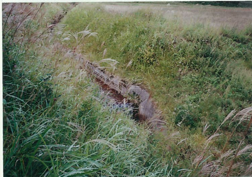
42)下和川 23. 同上。