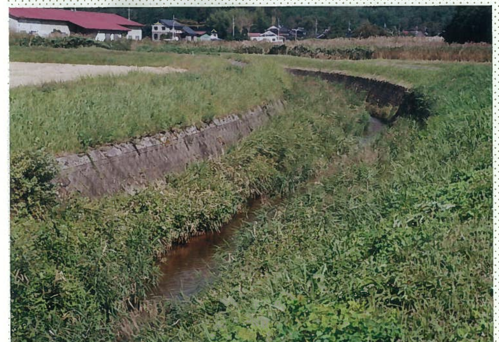
42)下和川 8. 河川状況。 魚は住みにくい川である。魚影も少ない。