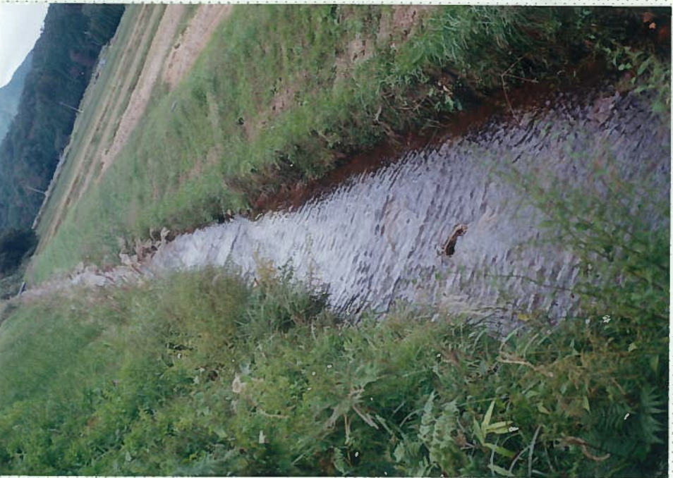
42)下和川 12. 同上。