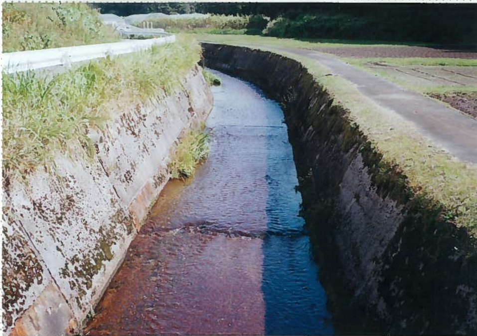
42)下和川 17. 三面張河川。 降雨は鉄砲水のように川を流下する。