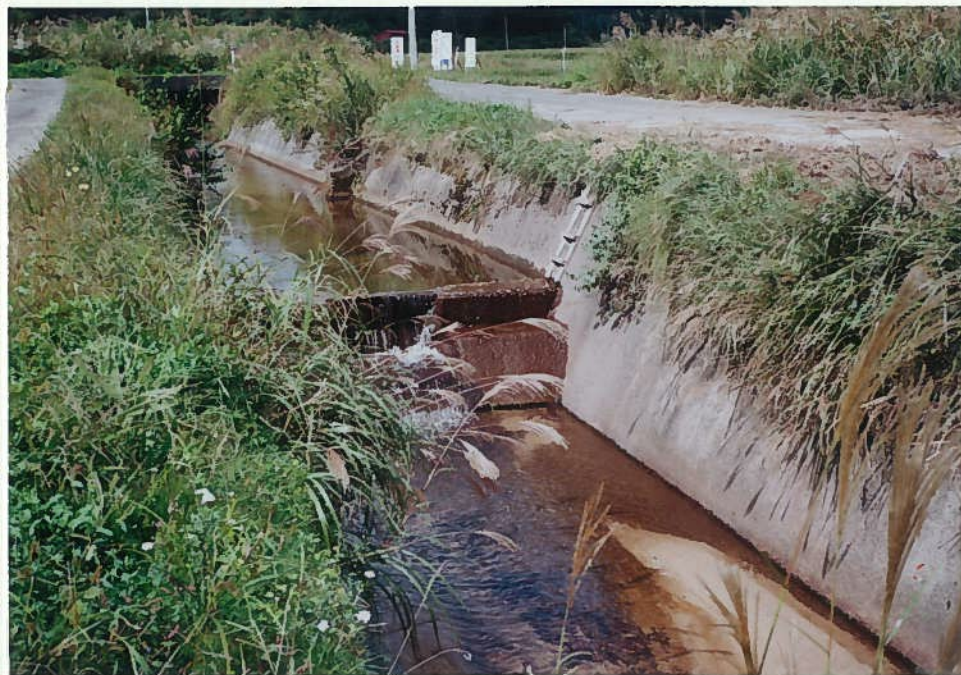
42)下和川 22. 三面張河川+段差工。