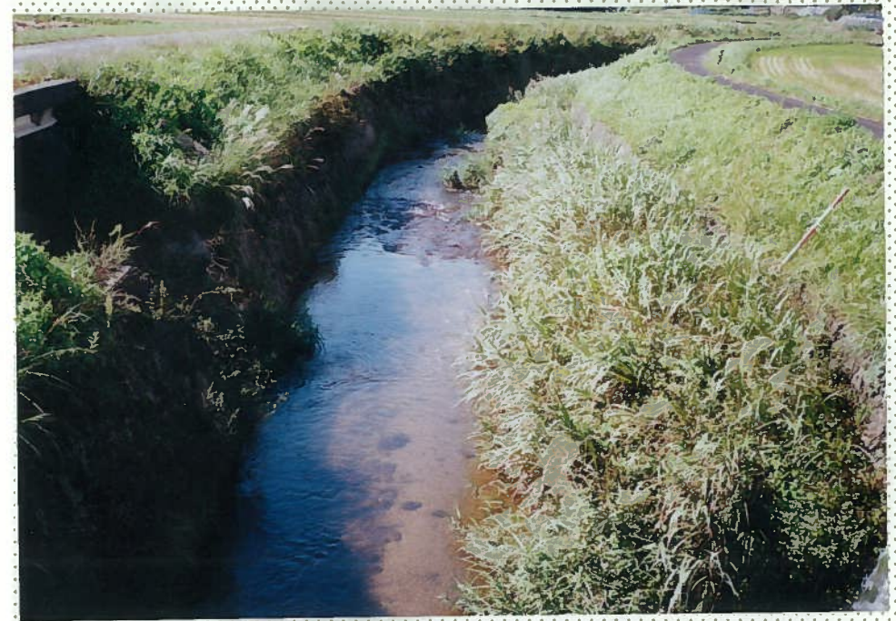
42)下和川 7. 両側をブロック積護岸で固められている。 小魚が少々いるのみ。