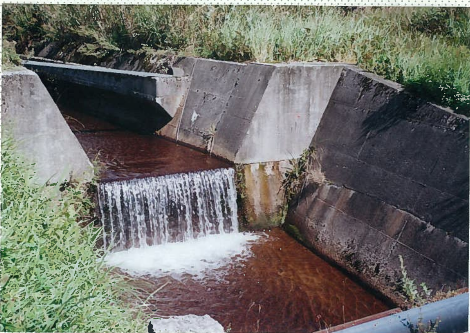
42)下和川 18. 同上。段差工。