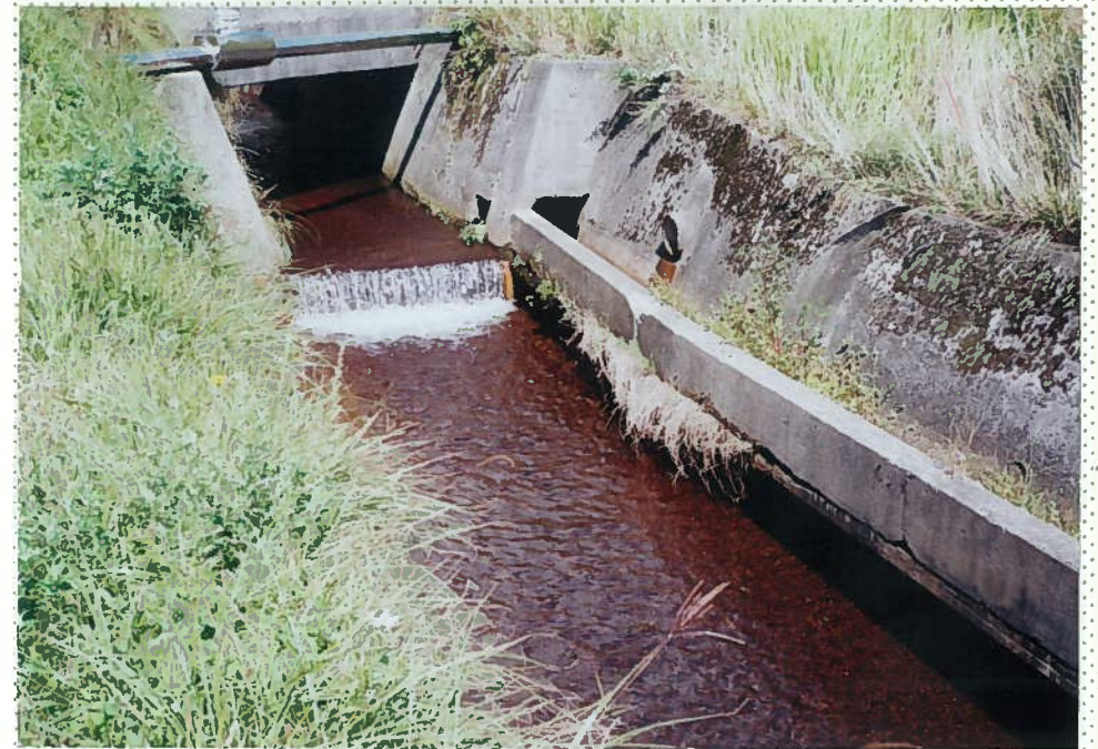
42)下和川 19. 三面張河川。