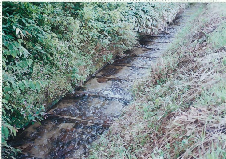
42)下和川 6. 両岸はコンクリート板。川床は侵食防止用床止工を施工している。