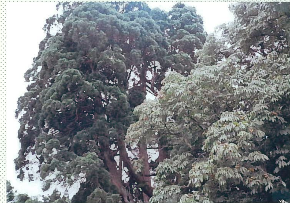
33)佐波良神社 28. 千年杉と栃の木。 上は6本の枝に分かれています。