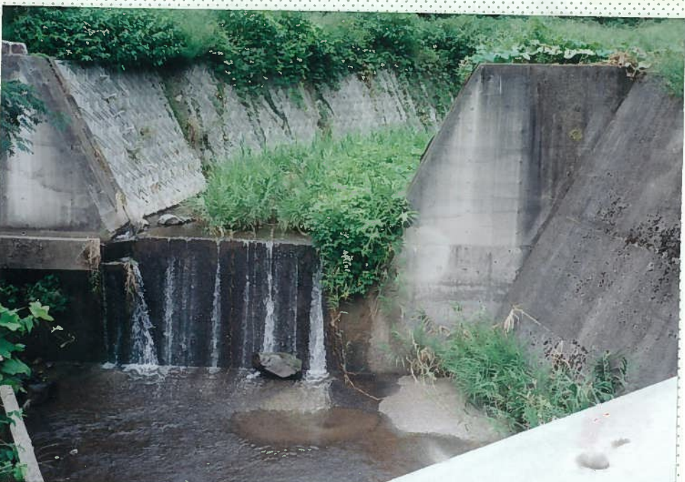
33)社川 23. h = 2 \text{ m} 。 同上。