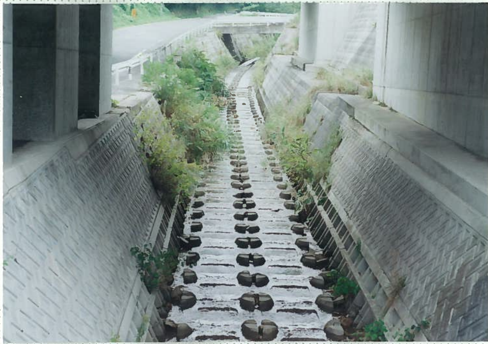
32)釘貫川 9. 道路公団による改修 工事。これより下流 に魚はほとんど見ら れない。