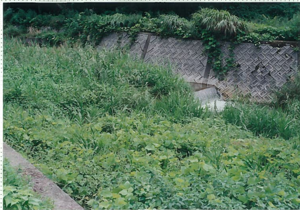
33)社川 15. h = 1 m。