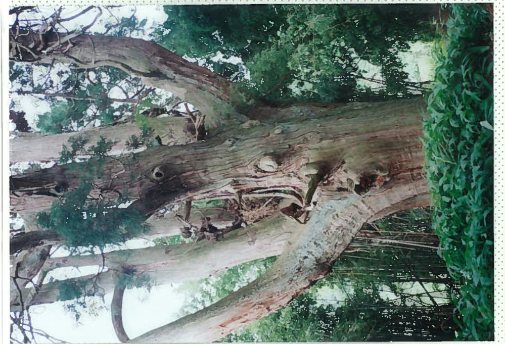
33)佐波良神社 30. 6本の枝に分岐している。