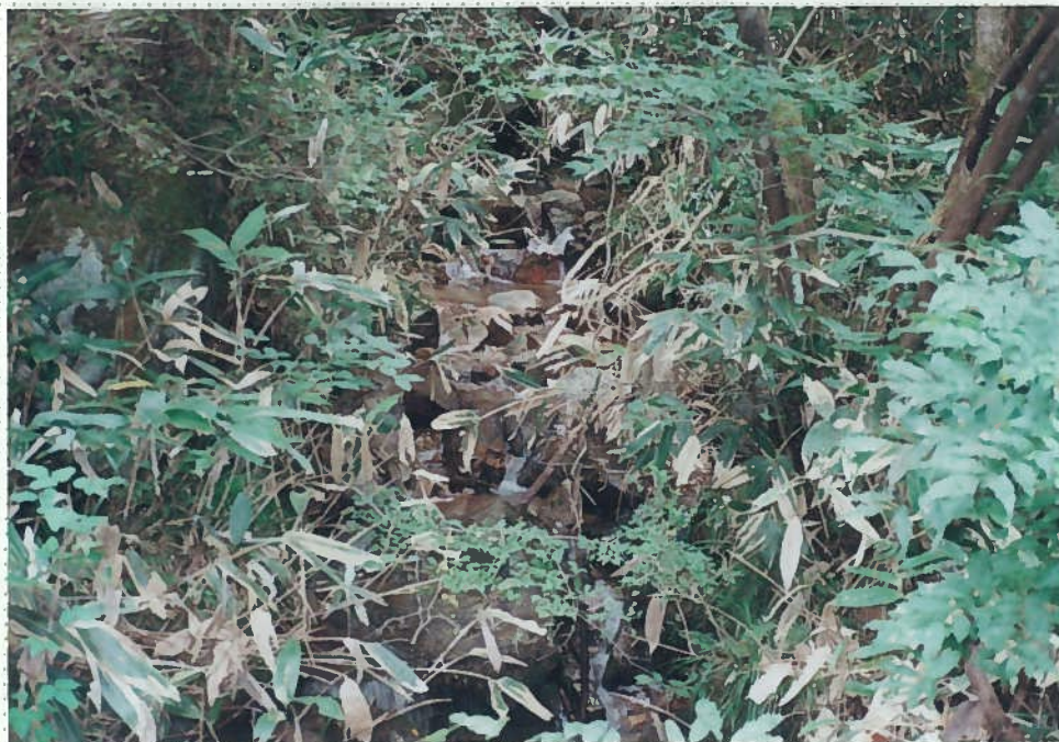
32)釘貫川 11. 同上。 草地は笹のみで、他 の草や植物はほとん ど無い。