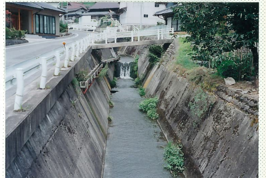
33)社川 20. 三面張+段差工。 魚の遡上、生息は不 可能である。