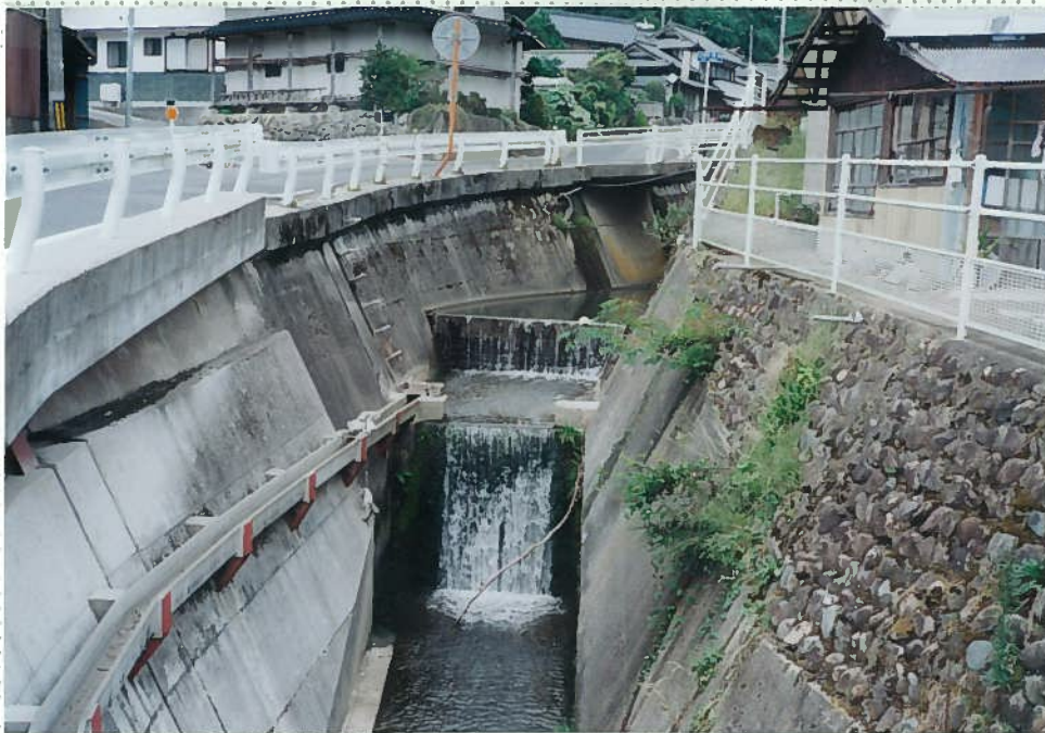
33)社川 21. 三面張+段差工が連続する。