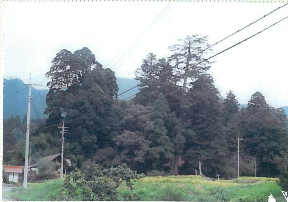
33)佐波良神社 27. 旧湯原町社の佐波良神社。NHK の宮本武蔵ロケ地。