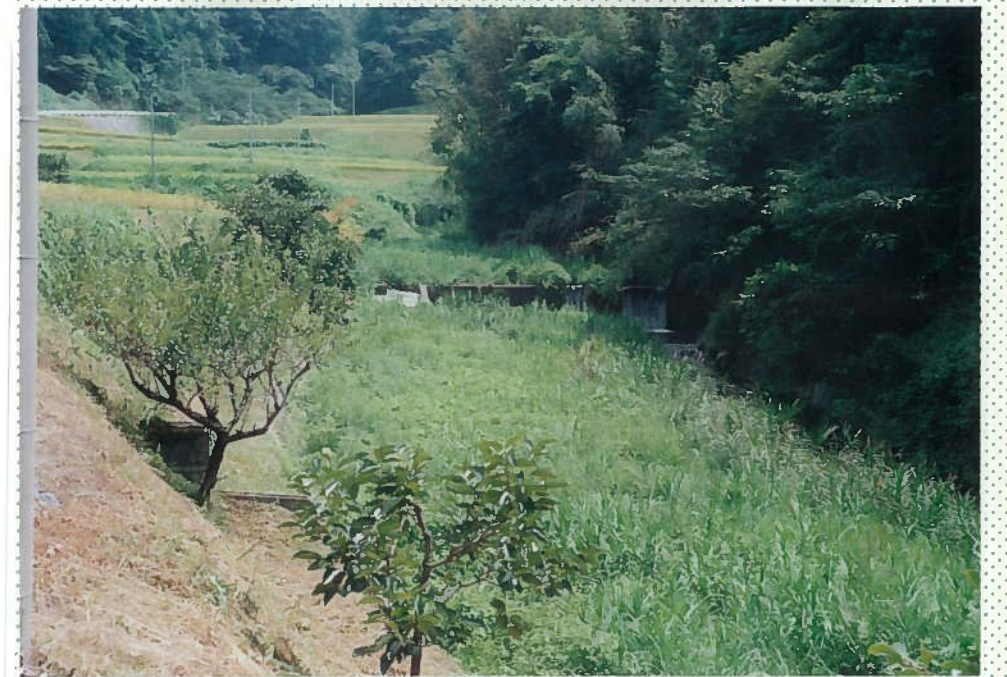
33)社川 18. h = 1.5 m。