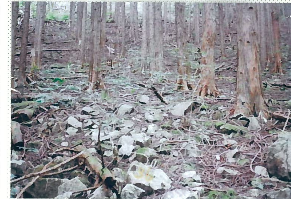
32)釘貫川 14. 腐葉土、表土が流失 し、礫が現れ、痩せ 地となっている。 谷の水質も貧栄養で、 泥水が流出し易い。