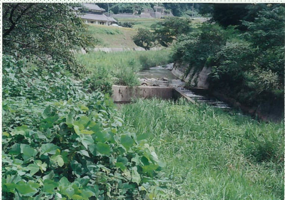
33)社川 17. h = 1.5 m。 同上。