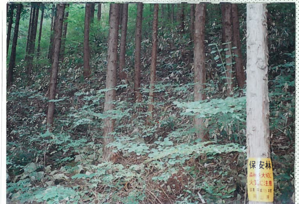
32)釘貫川 12. 植林地の地肌状況。 笹が茂り、地表を被 っている。