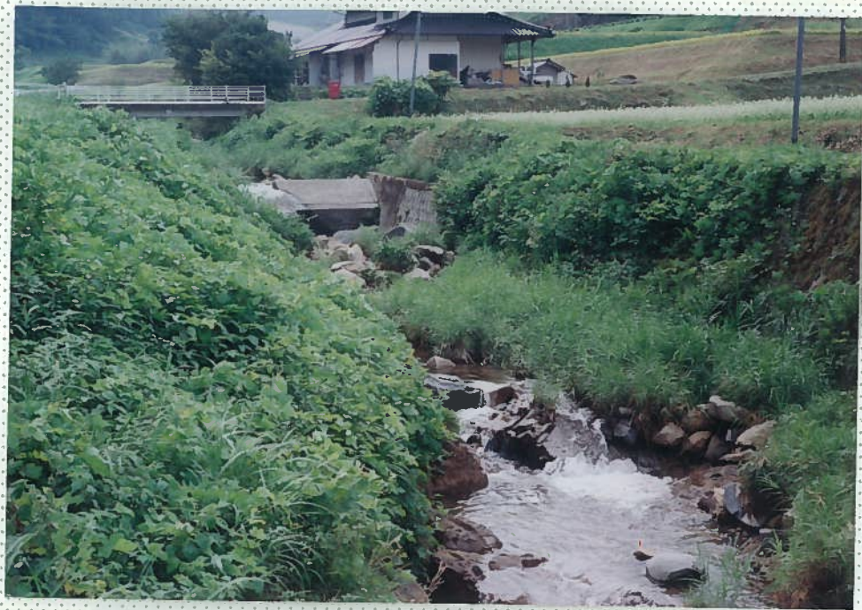
32)釘貫川 3. h = 1.5m。 頭首工を魚が上るのは難しい。