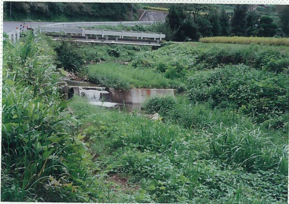
32)釘貫川 5. h = 1 m。