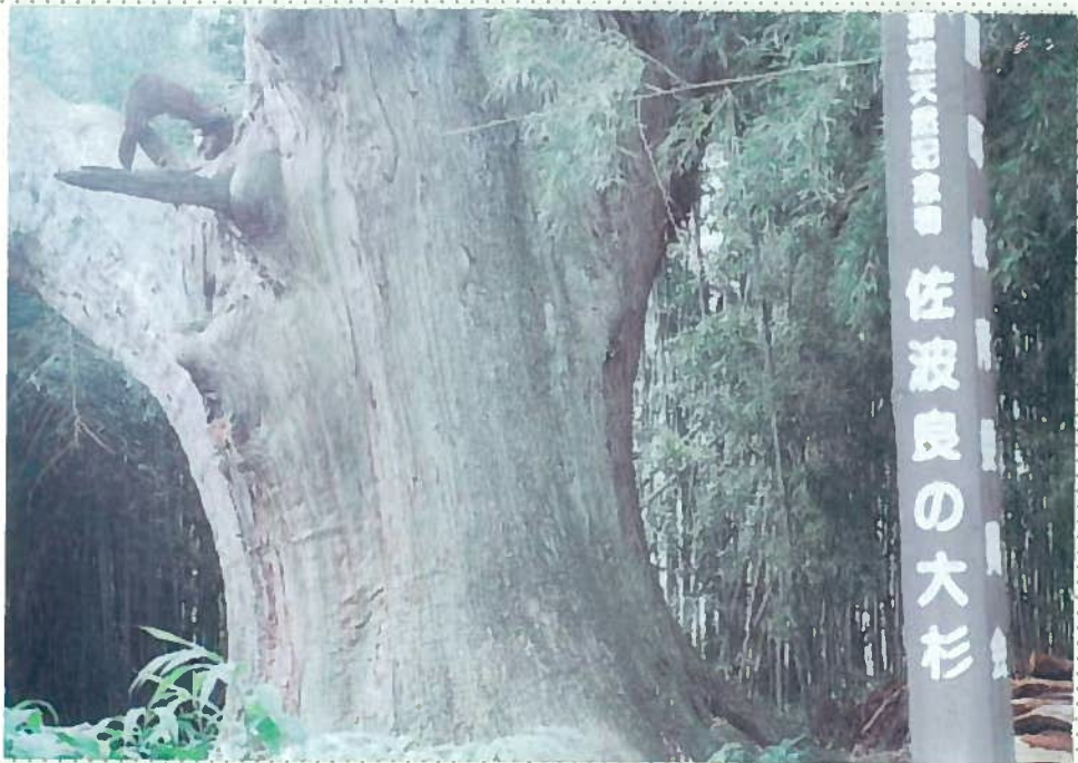
33)佐波良神社 29. 樹齢 900年と言われている。目通し周囲 9.1m。