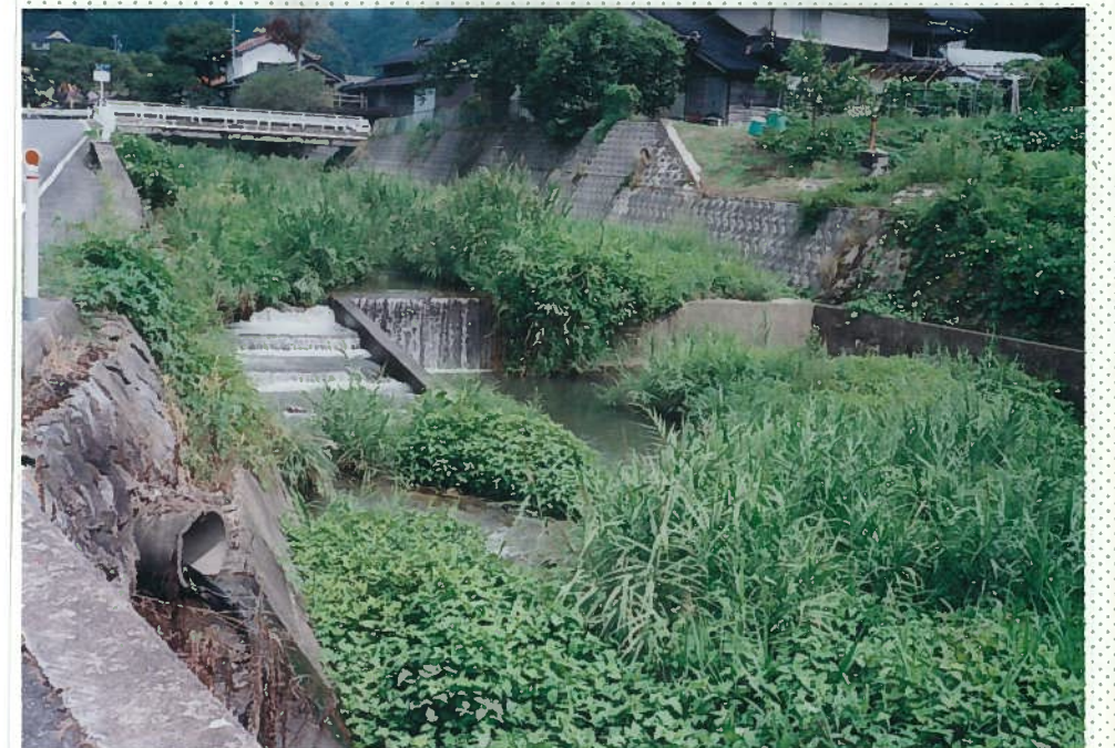
33)社川 19. h = 2 m。