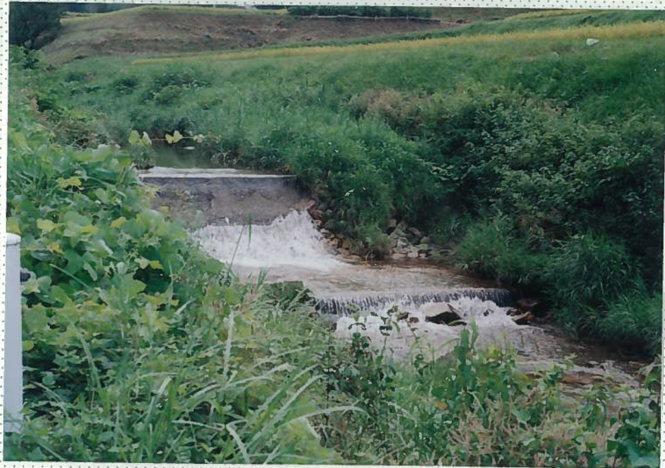
32)釘貫川 4. h = 1.5m。 同上。