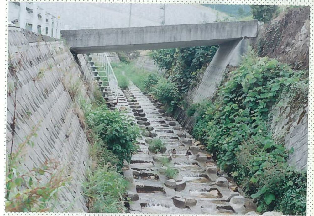
32)釘貫川 6. 道路公団で川床を十字ブロック敷きとしている。 魚影は見られない。