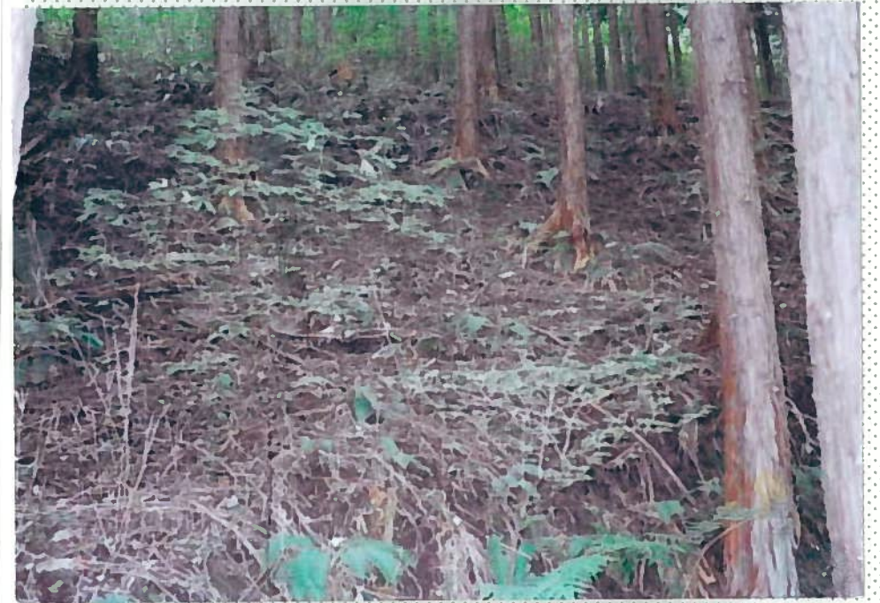
32)釘貫川 13. 笹も枯れ、地肌が露 出している。