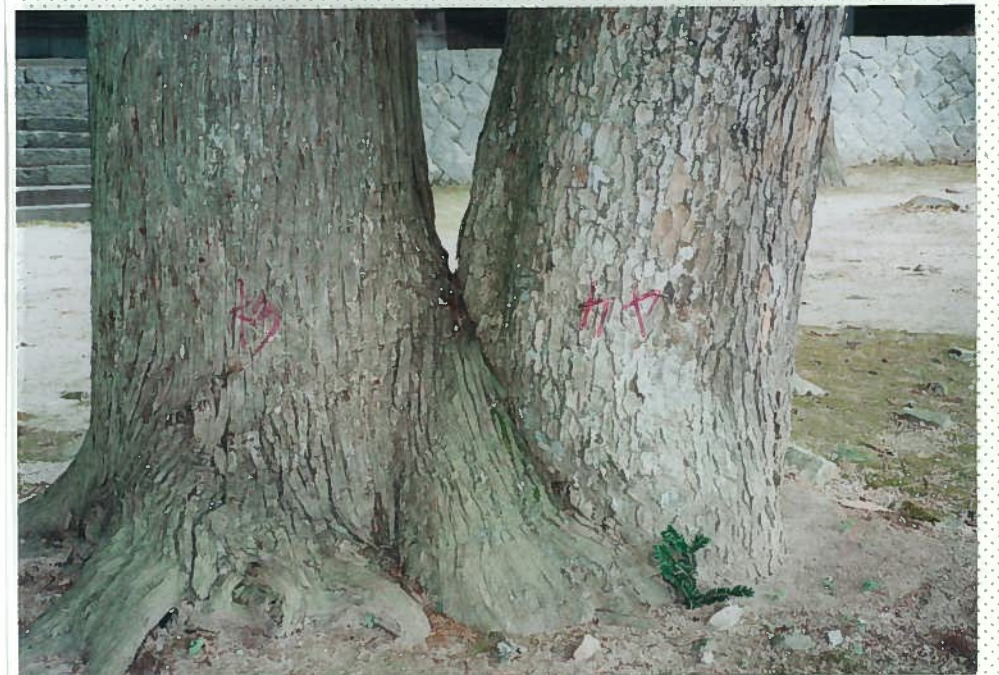
33)佐波良神社 31. 杉(左側)とカヤの木。