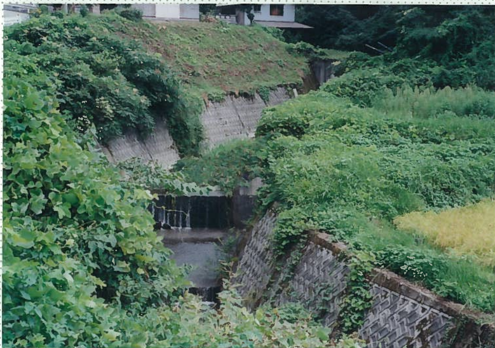
33)社川 22. 同上。