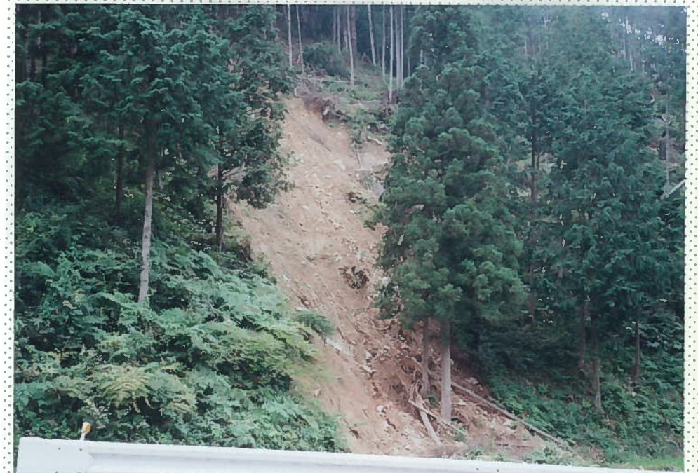
32)釘貫川 7. 風倒木地の崩壊。