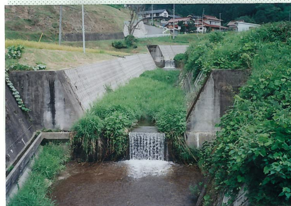
33)社川 25. 同上。