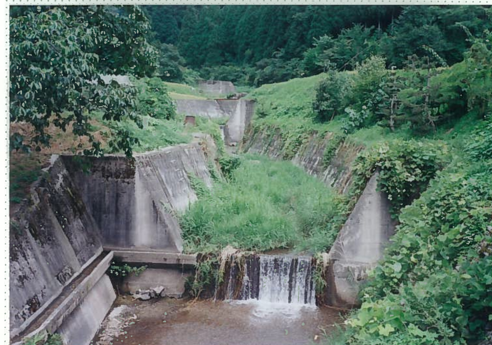
33)社川 26. 同上。