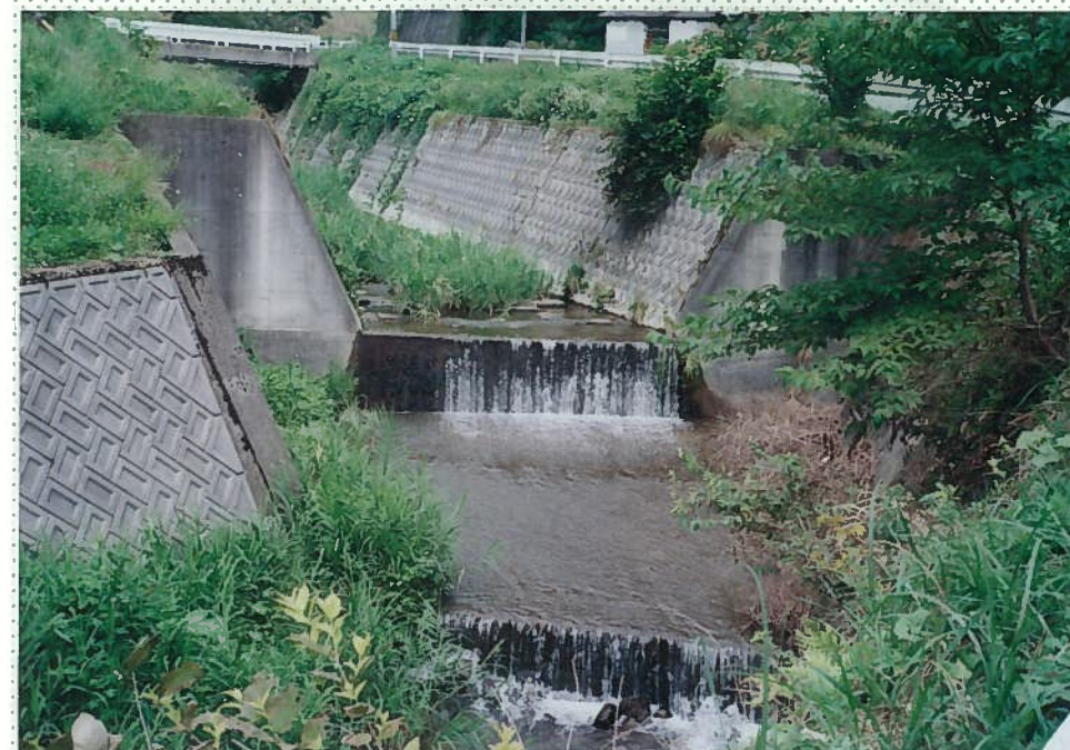
33)社川 24. 三面張+段差工が連続する。 魚の遡上、生息は不可能である。