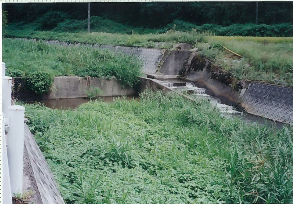
33)社川 16. h = 1.5 m。 魚道あり。魚に配慮 している。