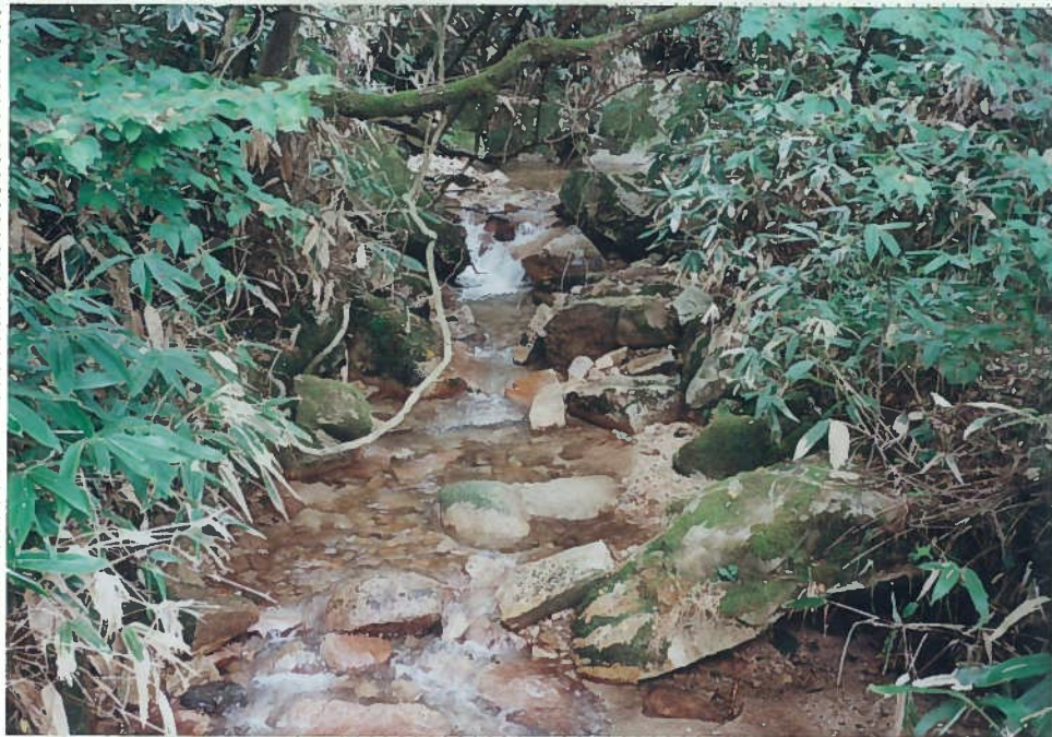
32)釘貫川 10. 自然状態。 花崗岩礫が堆積する。